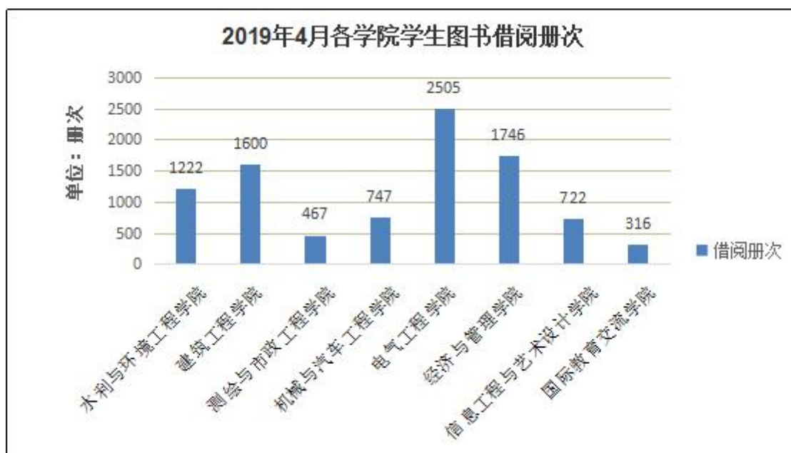
图 1：2019 年 4 月各学院学生借阅册次图