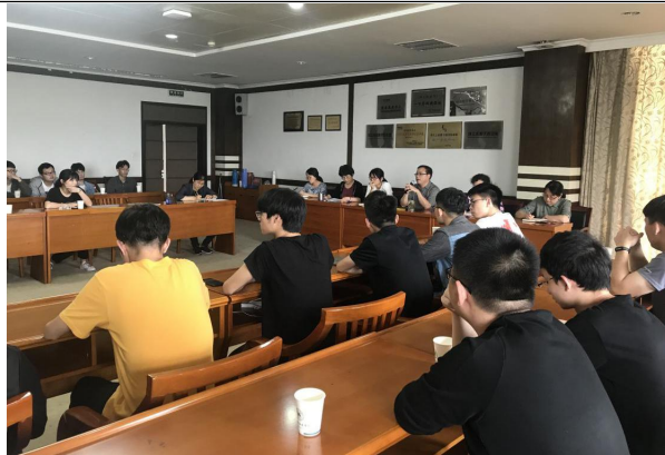
“建言献策”学生读者座谈会