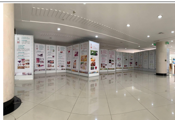
“中国人的光阴节”二十四节气展