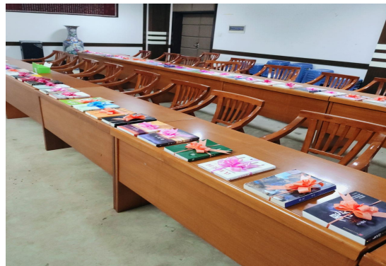
“书与时间的对话”借阅春日祭（2）