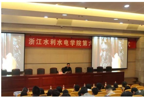
品味艺术——欧洲艺术精品赏析讲座