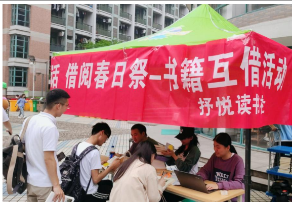
“书与时间的对话”借阅春日祭（1）