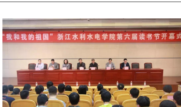
校第六届读书节开幕式