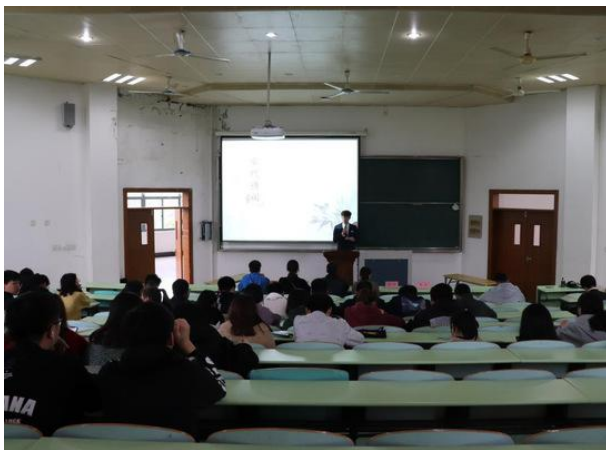
“朗朗风云梦，颂我中华魂”诗词知识竞赛