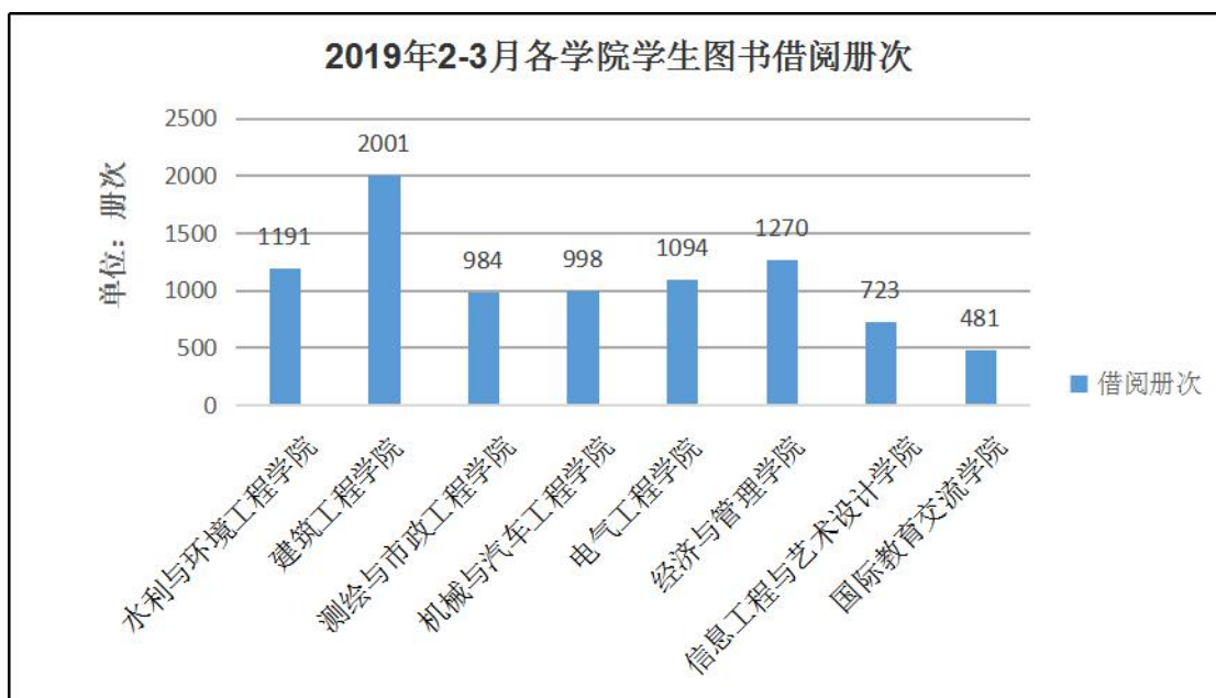
图 1：2019 年 2-3 月各学院学生借阅册次图